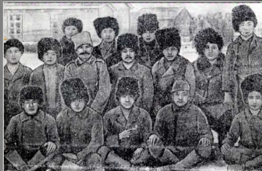
Буряты, мобилизованные на тыловые работы в Архангельск

Телеграмма из Архангельска о прибытии 3790 инородцев. 15 августа 1916 г.